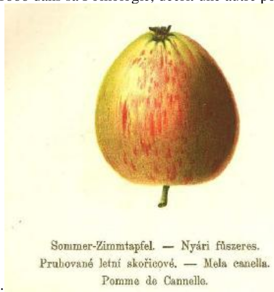
Sommer-Zimmtapfel. — Nyári fűszeres. Pruhovane letní skořicové. — Mela canella. Pomme de Cannelle.